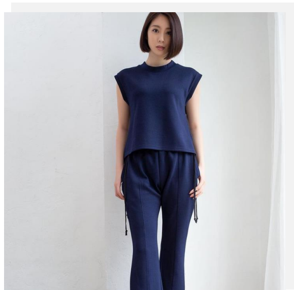
Print tanktop & Center seam flare pant

シンプルかつ羽織るだけで様になる幅広いスタイリングに活用出来るアイテム、着回しのしやすいベーシックカラーであるブラック、ホワイトに加えてブルー、グリーンの4色にて展開予定。さらにはセットアップ可能なアイテムや、締め付けの少ない部屋着としてのインナーウェアや、ご自宅で選択可能なイージーケアアイテムなどを展開します。