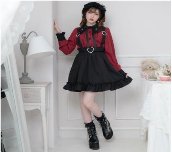
✦ 自撮り推し服 ✦